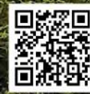
撰文：德善堂中醫